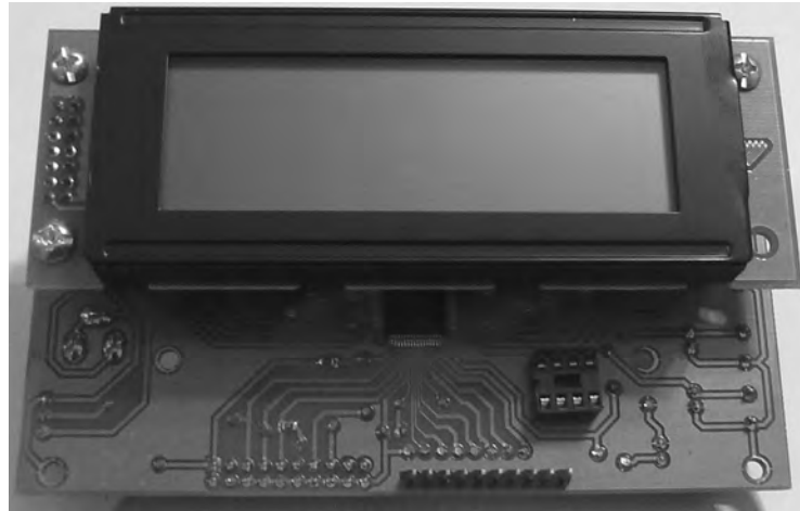
Figura 1. Foto del kit de desarrollo utilizado

conectó el kit a un equipo PC que permitiera la adaptación entre el protocolo TCP/IP sobre Wi-Fi a SLIP sobre UART, lográndose de esta manera acceder al sistema desde diferentes equipos en una red local, lográndose una estructura como la mostrada en la figura 2