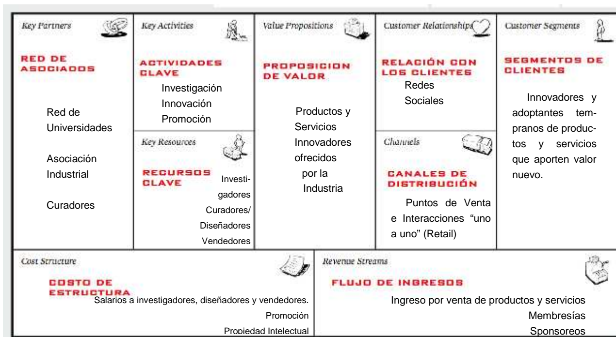
Fig. 3. Lienzo de modelo de negocios que integra los diferentes ítems mencionados en 2.1

En la siguiente figura podrá verse cómo luce el Lienzo de modelo de negocios completo.