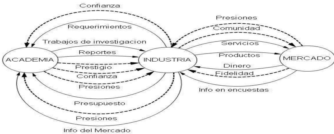
Fig. 4. Red de valor de un proceso genérico de colaboración Universidad – Industria con innovación abierta como vehículo de creación y transferencia de conocimiento entre los dos actores.

En la siguiente figura se muestra el mapeo de los flujos dinámicos de recursos que se han listado.