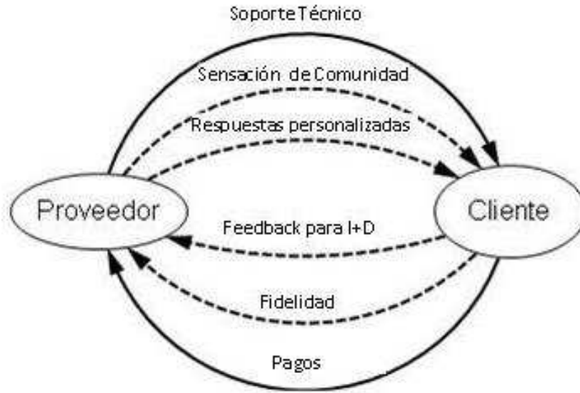
Fig. 1. Red de Valor entre un Proveedor y un Cliente.

En las siguientes figuras se mostrarán, a modo de ejemplo, algunas redes de valor.