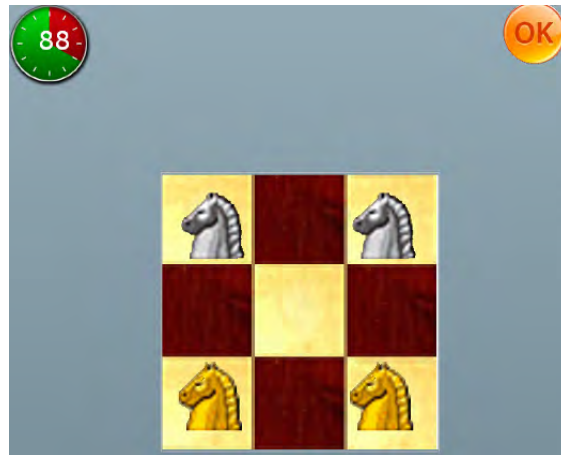
Figura 1. Juego de ingenio Four Knights.