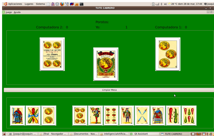
Figura 1. Interfaz gráfica

El juego fue desarrollado solo para tres jugadores: el usuario del mismo y dos jugadores virtuales. Para la implementación de este juego se utilizó el Entorno de Desarrollo Integrado (I.D.E.) QT [4] para el lenguaje de programación C++ [5]. En la figura 1 se muestra la interfaz gráfica mediante la cual el usuario interactúa con el juego.